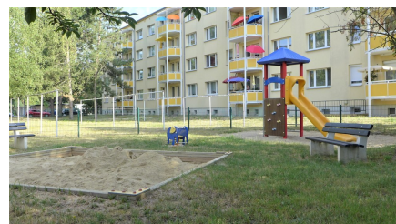
Spielplatz Am Dreieck